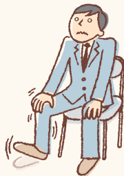
いろいろな、あせるなどの症状